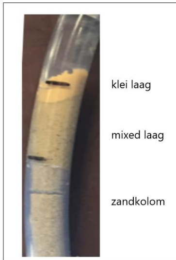
Figuur 1. Foto van de inspoeling van klei in een zandkolom