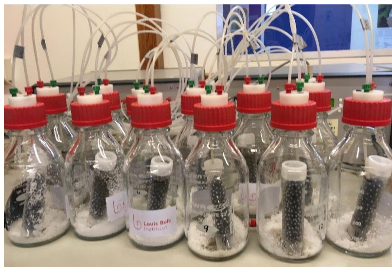
Figuur 3. Meetopstelling met veenkolommen in een laag perliet

Voorafgaand aan de incubatie van klei in veen werd er per kleisoort een suspensie gemaakt in twee concentraties. De kleisuspensie was een equivalent van het aanbrengen van een 1 cm kleilaag en van een 0,1 cm kleilaag op het veld. Per kolom kwam dat neer op 0,6